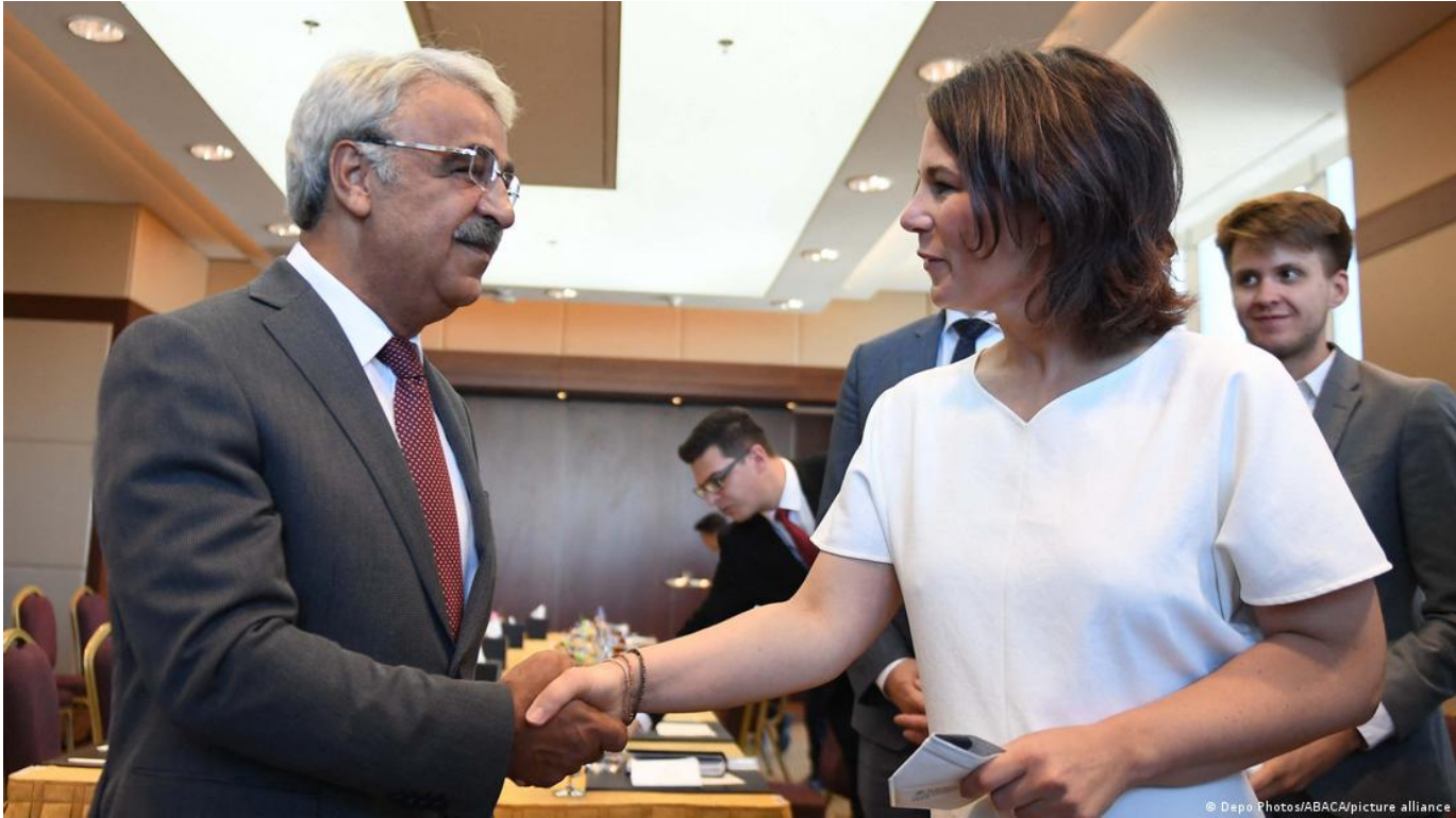
Almanya Dışişleri Bakanı Türkiye'de muhalefet partilerinin temsilcileriyle de görüştü

ülkeye öncelikle NATO'da ama aynı zamanda da uzun vadeli partner olarak ihtiyaç duyulduğunu vurguladı. Waedepuhl'a göre, belli konulardaki görüşler doğru olsa da akıllıca bir dış politika, bu tür meseleleri birebir yapılan ikili görüşmelerde dile getirmeyi öngörür.