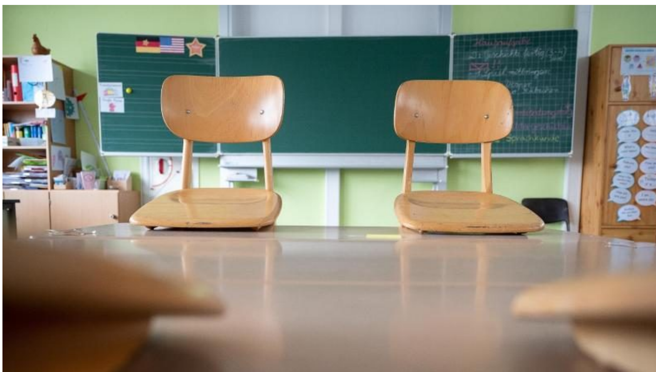
Ein leeres Klassenzimmer an einer Grundschule.

TICKER HOME DEUTSCHLAND AUSLAND CHINA WIRTSCHAFT MEINUNG FEUILLETON PANORAMA PREMIUM | SHOP