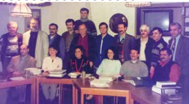
Gründungsmitglieder TGD/ TGD kurucu üyeleri, 1995

Wir verstehen Vielfalt als Normalität. Unsere verbandliche Diversität sehen wir als einen Gewinn für den Dialog mit zivilgesellschaftlichen und öffentlichen Organisationen sowie mit Stiftungen und Parteien.