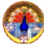
Yezidisches Forum e.V. in Oldenburg